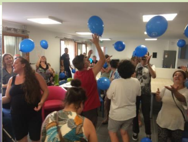
Tableau d'expression lors d'un « apéro du vendredi » et temps d'inclusion lors du 1 er Conseil des Habitants