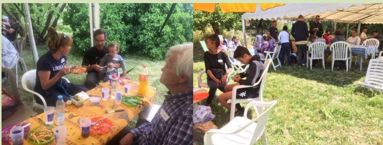
Le pique-nique du 11 mai autour des futurs habitants du Hameau Saint-François