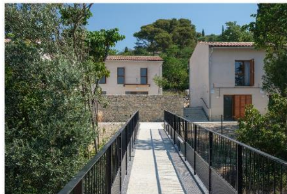
© Atelier Pirollet – Le Hameau Saint-François – juin 2019