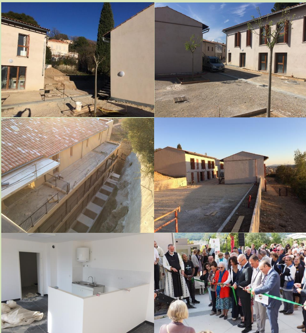
De la fin des travaux jusqu'à l'inauguration.

Un premier bâtiment se trouve sur l'avenue de Grasse. Il présente 3 étages sur un rez-de-chaussée faisant office de parking. Une cage d'escalier avec ascenseur communique par une passerelle avec les 3 autres bâtiments situés sur le plateau au-dessus. Ces 3 bâtiments sont faits d'un rez-de-chaussée et un étage. Ils s'articulent autour d'une placette et d'une petite rue centrale.